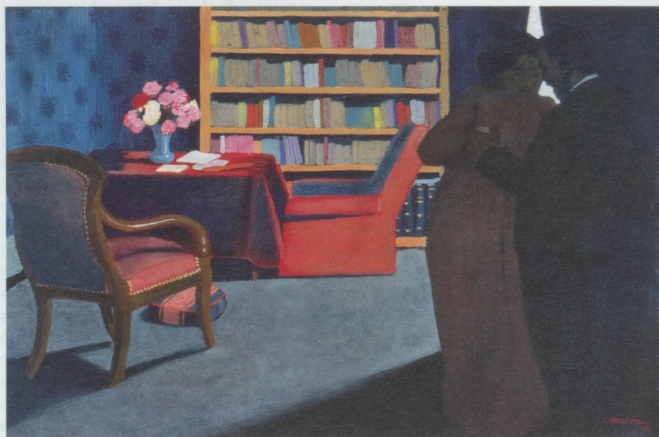
Félix Édouard Vallotton (Lausanne, 1865 – Paris, 1925). Le Colloque sentimental , 1898 Pastel sur papier, 455 x 655 mm. Coll. Cabinet d'arts graphiques, don Société des Amis du Musée d'art et d'histoire

Musée d'ethnographie, 4 rue Saint-Nicolas, CH-2000 Neuchâtel. Jusqu'au 15 septembre 2011, du mardi au dimanche de 10 h à 17 h.