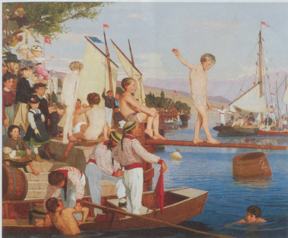
François Boccion, Jeux nautiques sur le lac Léman (La Fête de la Navigation) , 1870 Huile sur toile 63,5 x 76 cm

© Musée historique de Lausanne - Dépôt de la Société Vaudoise de Navigation