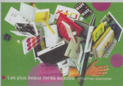
Les plus beaux livres suisses EXPOSITION / GRAPHISME

Centre culturel suisse, 32 rue des Francs-Bourgeois, 75003 Paris. Du mardi au vendredi de 10 h à 18 h, samedi et dimanche de 13 h à 19 h.