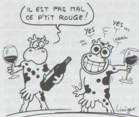
VIN ROUGE ET COCAÏNE

du CERN, le LHC (grand collisionneur de hadrons), et réalise des économies en ralentissant le rythme d'autres programmes. La direction du CERN estime qu'il s'agit d'un résultat positif pour le laboratoire dans le climat financier actuel.