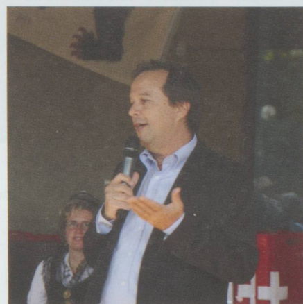
2 - L'ambassadeur Ulrich Lehner