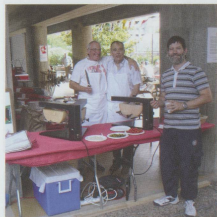
4 - La raclette