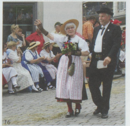
10 - Jura • 11 - Soleure • 12 - Vaud • 13 - Jodler-club-Wangen • 14 - Bouvier-Bernois • 15 - Appenzell • 16 - Berne-Argovie