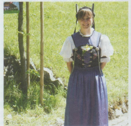
1 - Grisons • 2 - Nidwald • 3 - Haut-Valais • 4 - Genève • 5 - Toggenburg • 6 - Tessin • 7 - Ville-de-St-Gall • 8 - Lucerne • 9 - Schwyz