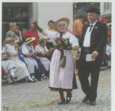
10 - Jura • 11 - Soleure • 12 - Vaud • 13 - Jodler-club-Wangen • 14 - Bouvier-Bernois • 15 - Appenzell • 16 - Berne-Argovie