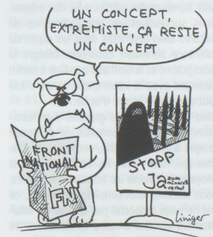
L'AGENCE GOAL, EXTRÊMEMENT PROPAGANDE...

■ L'agence Goal, qui a conçu l'affiche controversée de l'UDC pour la campagne antimigrants, va porter plainte contre le Front national. Le parti français a en effet détourné l'affiche pour sa campagne des élections régionales. « Notre agence va lutter avec tous les moyens contre ceux qui pillent nos idées. Nous ne voulons pas que nos affiches soient instrumentalisées, voire détournées, par d'autres partis politiques ou groupements », explique l'agence.