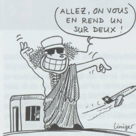
KADHAFI TOUT PUISSANT (LA SUITE...)