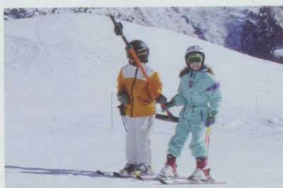
L'arbalète a fêté ses 75 ans.