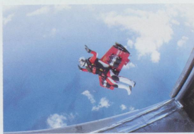
« Fusionman » cité dans la série américaine NCIS