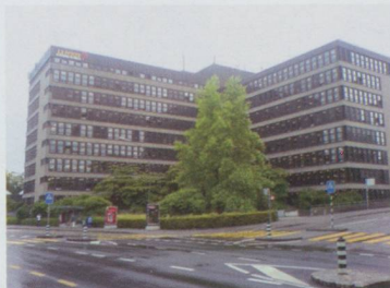
Troisième départ à la tête de la Poste suisse.