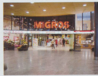
Migros élue « enseigne de l'année » en 2009.