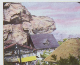
Village suisse : où ? Réponse dans le prochain numéro