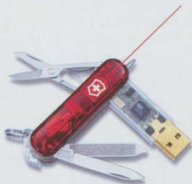
Clé USB pour le Remote de Victorinox.