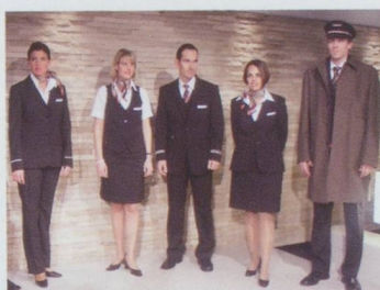
Nouvel uniforme pour la compagnie Swiss.