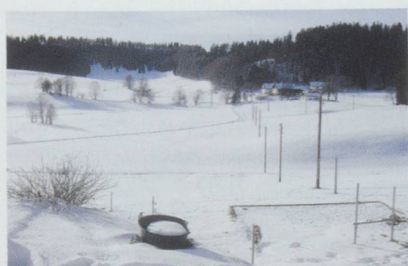
Nuit la plus froide de l'hiver : - 35,6° le 31 janvier à La Brévine (NE).