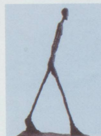
L'Homme qui marche de Giacometti, œuvre d'art la plus chère du monde.