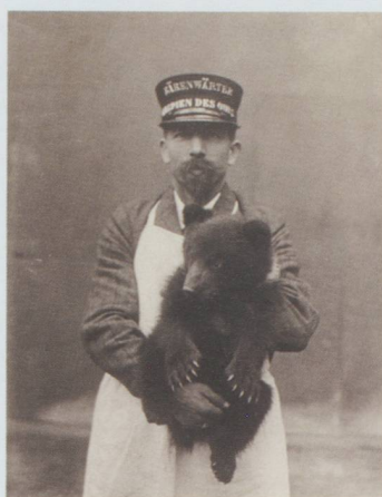
Anonyme : Berne, Le gardien de la Fosse aux ours avec un ourson, tirage au gélatino- bromure d'argent, 1910 - 20.