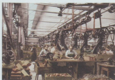
Fabrique de chaussures C.F. Bally, Schönenwerd, menuiserie, photochromolithographie, vers 1900.

Du mardi au dimanche de 10 h à 17 h, jeudi jusqu'à 19 h.