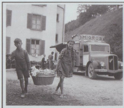
Theo Frey : Le camion Migros dans un village ouvrier de la vallée de la Töss, tirage au gélatino-bromure d'argent, 1942.

© Theo Frey / Fotostiftung Schweiz ; (aus : Schweizerische Landesmuseen, Sammlung Herzog)