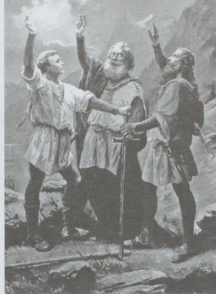
Le Serment du Grütli, un contrat de confiance

La fiducie peut être utilisée par un particulier pour déléguer la gestion d'un bien ou réaliser une opération de placement financier. Elle peut également permettre à des entreprises de mieux organiser leur patrimoine en séparant des activités différentes. En effet la fiducie crée une scission du patrimoine et constitue une entité autonome qualifiée de « patrimoine d'affectation ». Il ne faut donc pas la confondre avec l'hypothèque bien qu'un de ses usages possibles puisse être de garantir un emprunt.