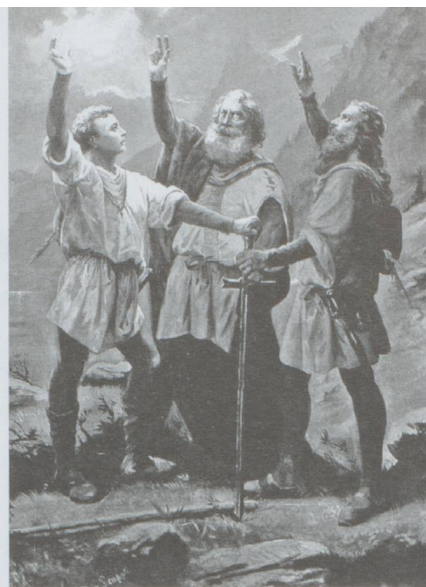
Le Serment du Grütli, un contrat de confiance

La fiducie peut être utilisée par un particulier pour déléguer la gestion d'un bien ou réaliser une opération de placement financier. Elle peut également permettre à des entreprises de mieux organiser leur patrimoine en séparant des activités différentes. En effet la fiducie crée une scission du patrimoine et constitue une entité autonome qualifiée de « patrimoine d'affectation ». Il ne faut donc pas la confondre avec l'hypothèque bien qu'un de ses usages possibles puisse être de garantir un emprunt.