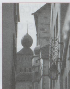
Brigue : vue sur le château Stockalper

Arrivés à Mörel, il faut impérativement prendre le téléphérique pour Riederalp, centre écologique, dans la région protégée Jungfrau-Aletsch, inscrite au Patrimoine mondial de l'UNESCO ou, à peine plus loin, celui de Bettmeralp. Les vues sur le plus grand glacier suisse sont tout simplement féériques. Ô surprise ! Le hameau de Grengiols est connu pour son espèce de tulipe unique au monde qui ne pousse qu'ici, Tulipa grengiolensis pour les férus de botanique. En mai, à l'époque de leur éclosion, 3 500 fleurs ont droit à la visite d'amateurs nombreux venant de la planète entière.