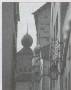
Brigue : vue sur le château Stockalper

Musée et chiens du St-Bernard – Martigny. Exposition temporaire du 18 mai à fin décembre 2009 : Masques de l'Himalaya.