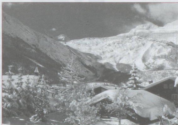
Saas Fee en hiver

Les temps changent ! Voici un petit extrait tiré des guides Joane , édition 1906 : « L'habitude à Louèche est de se baigner dans de grandes piscines carrées d'une profondeur de 1,20 m et pouvant contenir 25 à 30 personnes (sans parler des piscines de famille plus petites). Actuellement les sexes sont séparés dans des bassins différents. Ces derniers sont entourés par une balustrade de bois qui permet aux visiteurs de venir converser