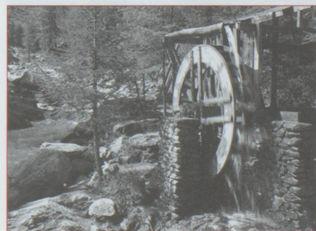
Roue à eau près de Saas Fée

Saas Fée, village sans voiture – il y a un immense parking à l'entrée – a su garder un charme infini. Ensermée dans un écrin brillant de 4000, la station offre une multitude de plaisirs hivernaux ou estivaux : ski sur un glacier tout à côté de crevasses géantes et impressionnantes mais parfaitement sécurisées, descente