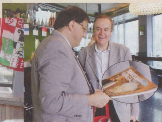
Tout ceci grâce à Suisse Magazine, visiblement copié, mais jamais imité...