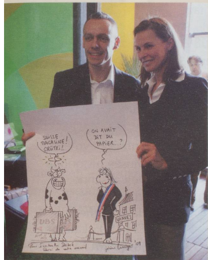
immédiatement croquée toute crue par Jérôme Liniger