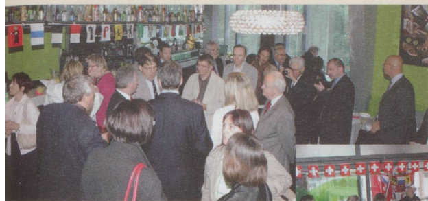
Une centaine de fidèles de Suisse Magazine...