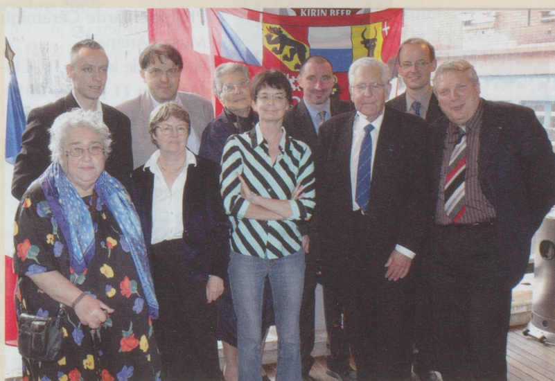
L'équipe de rédaction (ici presque au complet).

N'hésitez pas à nous appeler si vous n'avez pas reçu votre magazine, si vous avez un problème d'abonnement, si vous voulez passer une petite annonce, nous faire une suggestion de rédaction. Grand merci à ceux qui nous demandent des exemplaires pour faire connaître Suisse Magazine autour d'eux.