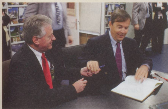
Nos autorités nous font l'honneur de signer sur place le livre d'or malgré l'exiguïté des locaux

Suisse Magazine - 9 rue Sadi Carnot 92170 Vanves. 01 41 08 13 92 le matin redaction@suissemagazine.com www.suissemagazine.com