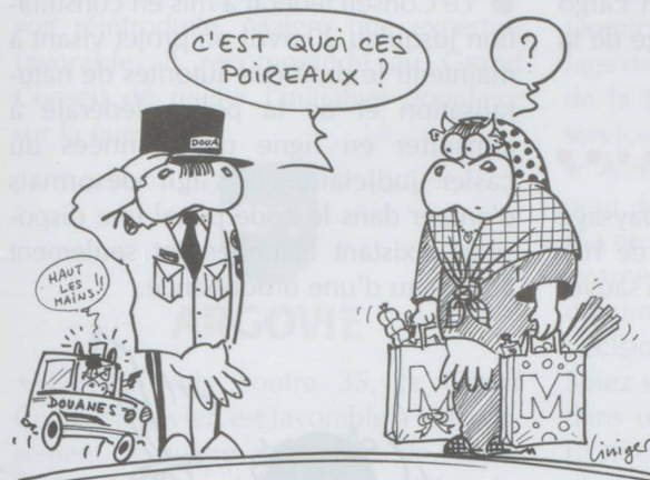
LES DOUANES VOLANTES AUTORISÉES DANS LES CANTONS...

● L'idée d'un deuxième tube au tunnel routier du Gothard revient sur le tapis. À l'unanimité, la commission des transports et des télécommunications du Conseil des États a chargé le Conseil fédéral de présenter un concept détaillé du projet d'ici à fin 2010. Le gouvernement devra énumérer quels travaux d'assainissements sont nécessaires et dans quels délais, quels seraient les avantages et les inconvénients d'un