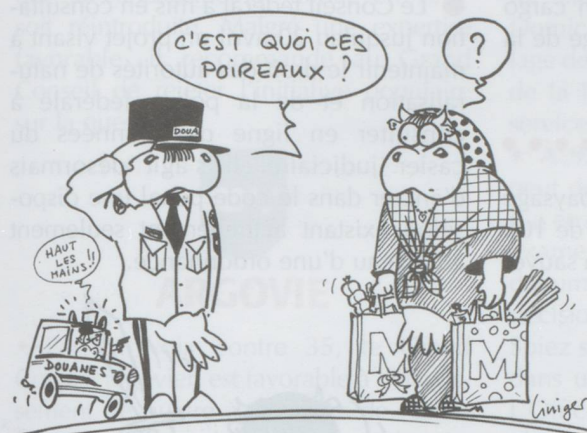
LES DOUANES VOLANTES AUTORISÉES DANS LES CANTONS...

● L'idée d'un deuxième tube au tunnel routier du Gothard revient sur le tapis. À l'unanimité, la commission des transports et des télécommunications du Conseil des États a chargé le Conseil fédéral de présenter un concept détaillé du projet d'ici à fin 2010. Le gouvernement devra énumérer quels travaux d'assainissements sont nécessaires et dans quels délais, quels seraient les avantages et les inconvénients d'un