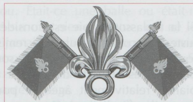
Fanion Légion étrangère

La Légion étrangère, qui apporte tant de pittoresque dans les défilés du 14 juillet, n'aurait jamais connu de si bons débuts sans les Suisses qui lui ont offert ses racines profondes.