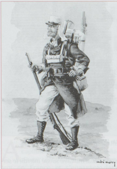
Un légionnaire en 1885

▷ Légion trouve dans le culte des nobles traditions militaires scellées dans le sang des vieux soldats suisses, un ferment essentiel de sa cohésion. Le 27 avril 1832, c'est le 3 e bataillon composé de Suisses et d'Allemands, qui a l'honneur du baptême du feu, aux avant-postes de Maison-Carrée. En mai 1832, le lieutenant suisse Cham se sacrifie avec ses hommes, inaugurant ainsi le grand livre de l'héroïsme helvétique à la Légion. L'historienne Evelyne Maradan a très bien montré l'importance des Suisses dans la Légion et nous lui empruntons ici nombre d'éléments ayant trait à la « glorieuse canaille ». Pour Evelyne Maradan : « La présence de Suisses dans la Légion, c'est la garantie de la pérennité et de la fiabilité de cette splendide machine de guerre ou plutôt de pacification, ô combien fragile, car composée non pas d'hommes superbes, mais d'un ramassis de toutes les nations, comme disait le futur maréchal Saint-Arnaud » 6 . Cette subtile mécanique risquait en effet à tout moment de se gripper du fait d'une cohabitation difficile entre les différentes nationalités. Habités à coexister au sein d'une Confédération plurilingue, les Suisses sont en quelque sorte des médiateurs, des traits d'union entre légionnaires de toutes provenance. L'écrivain allemand Ernst Jünger s'étonnait, en arrivant à la Légion à Marseille de voir que le 1 er sous-