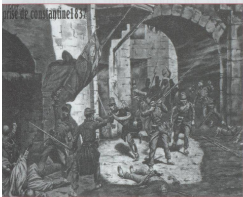
La prise de Constantine en 1837