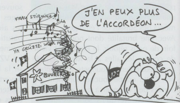
BRUNNER QUITTE BUURERADIO...

■ Le président de l'UDC, Toni Brunner, abandonne le poste de rédacteur en chef de la radio paysanne sur Internet Buureradio , lancée en 2005. La radio est dirigée par une nouvelle équipe qui souhaite se concentrer davantage sur la diffusion de musique folklorique suisse.