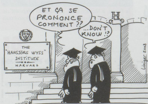
142 MILLIONS OFFERTS À HARVARD PAR UN DONATEUR PRIVÉ SUISSE

■ Deuxième fortune de Suisse, Hansjörg Wyss a fait un don de 142 millions de francs à l'université américaine de Harvard. L'entrepreneur et ingénieur bernois y avait obtenu un MBA en 1965. Hansjörg Wyss devient ainsi le donateur individuel le plus généreux de l'histoire de Harvard. L'institut de bio-ingénierie qui portera son nom aura pour mission d'étudier les modes de construction des êtres vivants et d'utiliser ce savoir pour concevoir des technologies à usage médical. L'institut emploiera des spécialistes des robots, de la biologie et de la chirurgie.