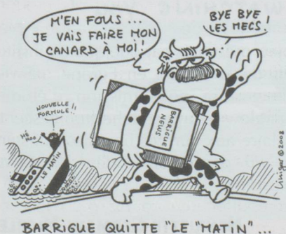
BARRIGUE QUITTE "LE MATIN" ...

■ L'espace aérien suisse a été violé 200 fois l'an dernier, soit une hausse de 41 % par rapport à 2006, indique l'Office fédéral de l'aviation civile (OFAC). Selon l'OFAC, la plupart des cas de violation de l'espace aérien sont en fait l'œuvre de pilotes amateurs volant à bord de petits appareils, en particulier au cours de l'été. Face à la forte augmentation du nombre de violations, l'office a lancé une campagne d'infor-