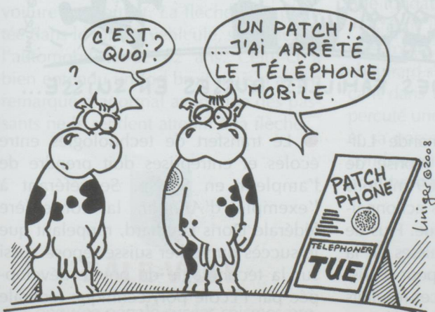
LE NATIONAL REJETTE L'IDÉE : « TÉLÉPHONER AVEC UN PORTABLE PEUT ÊTRE NOCIF POUR LA SANTÉ »