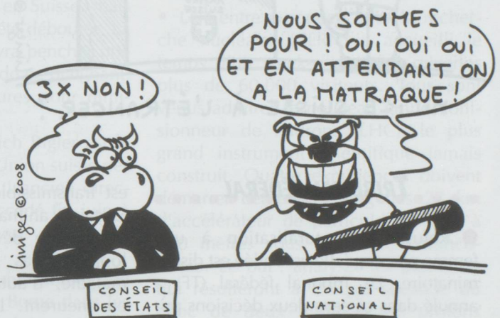
PETITE DIVERGENCE D'OPINIONS SUR LE PISTOLET À ÉLECTROCHOC