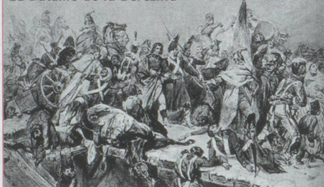
La bataille de la Berezina