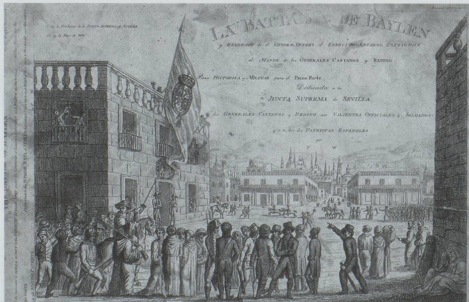
La bataille de Baylen