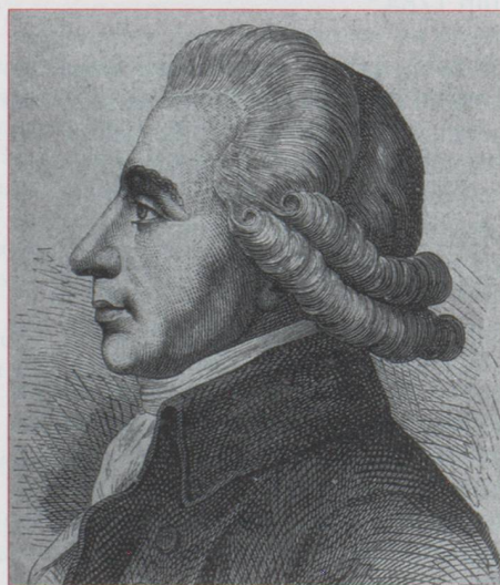
Emmanuel Joseph Sieyès