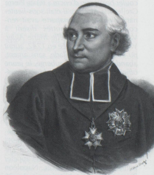
Le cardinal Fesch

même, dit-on, une assez grande quantité de tableaux, statues et choses précieuses qui, depuis, ont servi à décorer ses différentes résidences. Plus tard, devenu archevêque de Lyon et cardinal, il eut le bon esprit de se pénétrer des devoirs de ces deux dignités, et il finit par acquérir dans le clergé une réputation assez honorable » 5 . Le Musée Napoléonien de l'Hôtel de Ville d'Ajaccio conserve plusieurs représentations du cardinal Fesch. Après la chute définitive de son neveu, il s'installe à Rome. À son décès le 13 mai 1839, le cardinal Fesch laissa une formidable collection de 16 000 tableaux, dont près d'un millier constituent le noyau de la collection du Musée Fesch. Sa dépouille ainsi que celle de Madame Mère reposent depuis 1860 dans la chapelle impériale à Ajaccio. ▷