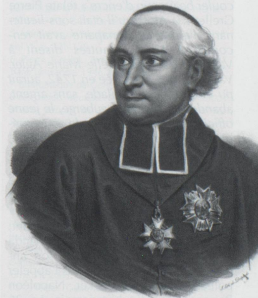
Le cardinal Fesch

même, dit-on, une assez grande quantité de tableaux, statues et choses précieuses qui, depuis, ont servi à décorer ses différentes résidences. Plus tard, devenu archevêque de Lyon et cardinal, il eut le bon esprit de se pénétrer des devoirs de ces deux dignités, et il finit par acquérir dans le clergé une réputation assez honorable » 5 . Le Musée Napoléonien de l'Hôtel de Ville d'Ajaccio conserve plusieurs représentations du cardinal Fesch. Après la chute définitive de son neveu, il s'installe à Rome. À son décès le 13 mai 1839, le cardinal Fesch laissa une formidable collection de 16 000 tableaux, dont près d'un millier constituent le noyau de la collection du Musée Fesch. Sa dépouille ainsi que celle de Madame Mère reposent depuis 1860 dans la chapelle impériale à Ajaccio. ▶