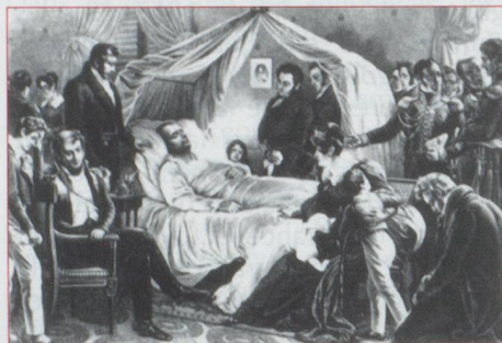
Napoléon sur son lit de mort

Le monde de la banque suit naturellement avec la plus grande attention l'évolution des événements. Malheur