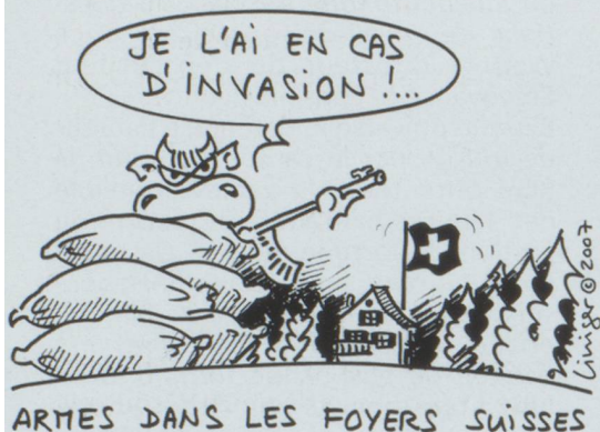
ARMES DANS LES FOYERS SUISSES

● Les Jeunes Verts ont lancé leur première initiative « pour une mobilité humaine et durable ». Elle propose d'interdire les véhicules qui rejettent plus de 250 grammes de dioxyde de carbone par kilomètre. C'est le cas d'environ la moitié des véhicules tous terrains (4X4) actuelle-