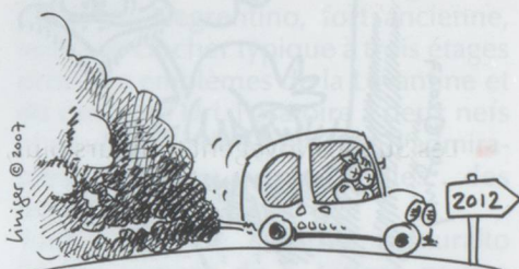
ÉMISSIONS DE CO 2 À RÉDUIRE ...

■ Les nouvelles voitures de tourisme immatriculées en Suisse devraient s'aligner dès 2012 sur les normes européennes concernant les émissions moyennes de CO 2 . La Commission européenne doit présenter dans les prochaines semaines un projet de législation pour réduire à l'horizon 2012 les émissions des voitures neuves à un plafond de 120 grammes de CO 2 par kilomètre parcouru en moyenne.