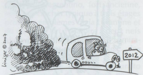
ÉMISSIONS DE CO 2 À RÉDUIRE ...

■ Les nouvelles voitures de tourisme immatriculées en Suisse devraient s'aligner dès 2012 sur les normes européennes concernant les émissions moyennes de CO 2 . La Commission européenne doit présenter dans les prochaines semaines un projet de législation pour réduire à l'horizon 2012 les émissions des voitures neuves à un plafond de 120 grammes de CO 2 par kilomètre parcouru en moyenne.