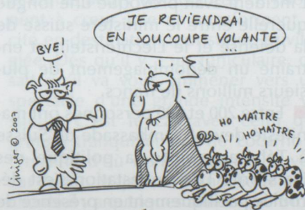
RAËL REFUSÉ EN SUISSE ...

■ En Suisse, un enfant sur cinq a des kilos en trop. La fondation Promotion santé suisse a lancé sa campagne « poids corporel sain », au moyen d'affiches au slogan évocateur : « La Suisse prend du ventre. Alors, on se bouge ? ».. Elle veut rendre attentifs les enfants, les adolescents et les adultes aux conséquences d'un surpoids sur la santé. Le surpoids concerne près de 2,3 millions de Suisses. Cette tendance s'avère particulièrement inquiétante chez les jeunes : le nombre d'enfants en surpoids a triplé durant les vingt dernières années. La fondation s'engage en faveur du maintien des heures de gymnastique dans les écoles et pour