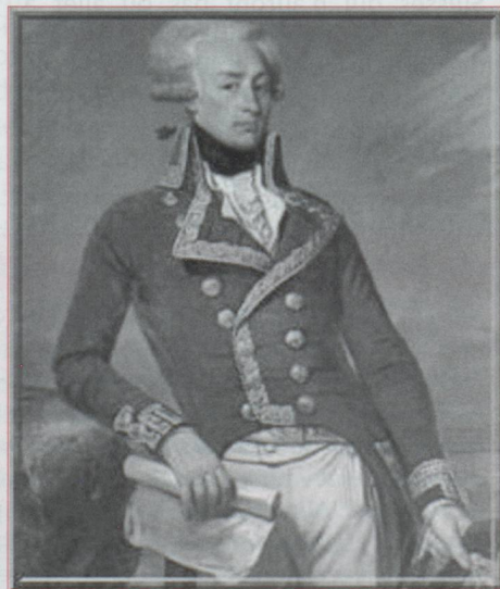
M. de La Fayette

22 e régiment d'infanterie légère à l'armée de l'Ouest en 1795, dont huit Français, deux Allemands, trois Soleurois, quatre Bernois, trois Grisons, deux Jurassiens, un Neuchâtelois, un Valaisan, un Fribourgeois né à Versailles 9 . On relève dans un autre état portant sur les « hommes qui ont servi dans les régiments suisses » 34 noms « de vieux militaires qui servent dignement la patrie » 10 . Parmi eux quatre Allemands, quatre Français, six Fribourgeois, quatre Soleurois, trois Bernois, trois Valaisans, un Lucernois, un Schwytzois, un Jurassien, un Zurichois. Ainsi y avait-il en Vendée vers 1795, plus de Suisses parmi les « Bleus » que parmi les « Blancs ».