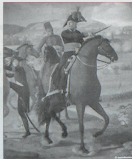
Le général Turreau

Celui que l'on surnomma le « boucher de la Vendée » devient, dans une autre vie, baron sous l'Empire par décret impérial du 19 mars 1808 et reçoit une dotation de 4 000 francs de rente. Valeureux, il a à nouveau deux chevaux tués sous lui à Eylau le 8 février 1807. À l'armée d'Espagne en 1809-1810, il se distingue au siège de Gironne. En 1812, lors de la campagne de Russie, il commande une brigade (2ème Croate, 4ème Suisse) de la division Belliard, 2ème corps sous Oudinot et se distingue à Polotsk. Les 18-19 novembre 1812 il est blessé au passage de la Bérézina, où les Suisses se sacrifient en couvrant le passage et sont réduits à 300 hommes. Fait général de division pour sa conduite à la Bérézina le voilà grand officier de la Légion d'honneur, le 10 août 1813. Le 25 mars 1814, il est à la tête d'une des divisions de gardes nationales mobilisées qui, sous les ordres de Pacthod - originaire de Saint-Julien-en-Genevois - se font héroïquement hacher à La Fère-Champenoise le 25 mars 1814 après avoir soutenu pendant six heures un combat inégal. Accablé par des forces innombrables, dirigées par l'empereur Alexandre et le roi de Prusse, Pacthod se vit forcé de se rendre avec ses troupes, dont plus de la moitié était hors de combat. Les deux souverains, témoins de cette défense héroïque, accueillirent le fer de lance de cette action d'éclat avec distinction sur le champ de bataille même. Peu rancunier, ou plutôt amnésique à ses