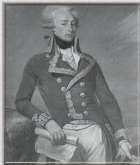
M. de La Fayette

22 e régiment d'infanterie légère à l'armée de l'Ouest en 1795, dont huit Français, deux Allemands, trois Soleurois, quatre Bernois, trois Grisons, deux Jurassiens, un Neuchâtelois, un Valaisan, un Fribourgeois né à Versailles 9 . On relève dans un autre état portant sur les « hommes qui ont servi dans les régiments suisses » 34 noms « de vieux militaires qui servent dignement la patrie » 10 . Parmi eux quatre Allemands, quatre Français, six Fribourgeois, quatre Soleurois, trois Bernois, trois Valaisans, un Lucernois, un Schwytzsois, un Jurassien, un Zurichois. Ainsi y avait-il en Vendée vers 1795, plus de Suisses parmi les « Bleus » que parmi les « Blancs ».