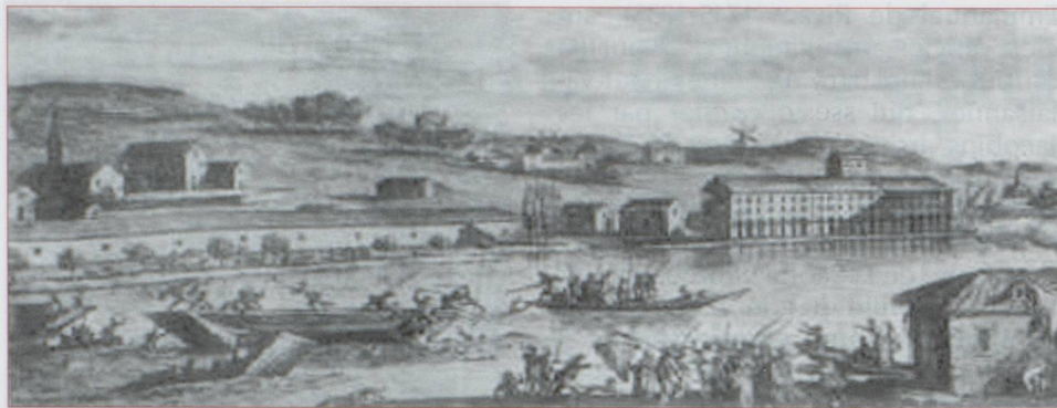
Les noyades de Nantes

cienne catholique de Lucerne 16 , canton comptant parmi les plus attachés à la monarchie française. Cet ancien sous-lieutenant dans la compagnie de Salis, de la Garde suisse en 1784, aide de camp de La Fayette à l'armée du Nord, puis adjudant à l'état-major général des Pyrénées orientales à Toulouse, le 1 er octobre 1792, sera adjudant-général, chef de bataillon le 24 novembre 1794, général de brigade à l'armée de l'Ouest le 5 octobre 1795 17 .