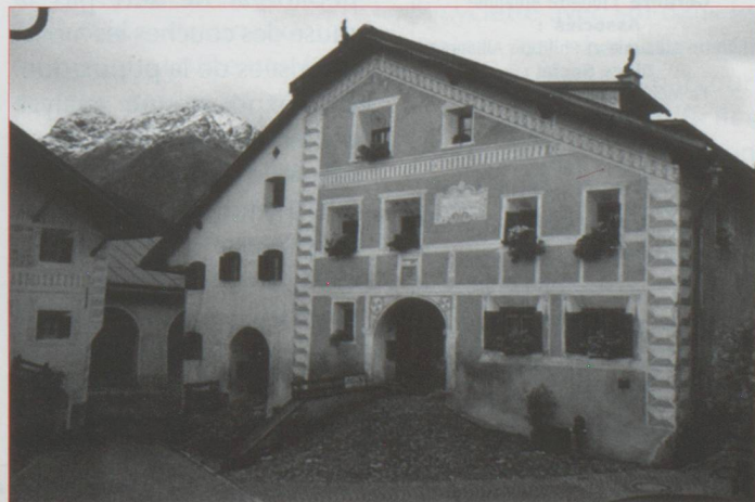
Maison engadine à Guarda

Marcel Proust (Les Plaisirs et les Jours - Les regrets - Rêveries couleur du temps - XXII)