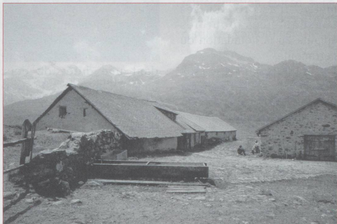
Alp da stretta

Nous parlons toujours moins que nous ne le souhaiterions de la Suisse orientale. Nous vous proposons aujourd'hui de découvrir une vallée peu connue, le Val da Fain. Début d'une série ?