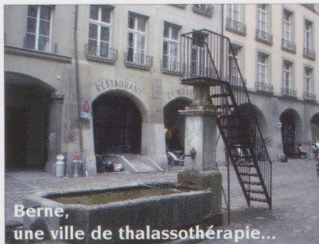
Berne, une ville de thalassothérapie...