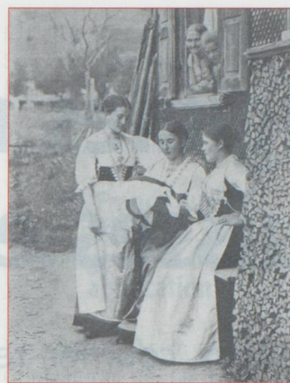
Brodeuses de l'Appenzell

directe a traversé les siècles et il est intéressant d'en souligner quelques aspects. La Suisse n'est pas un état, mais une association de petits états, une « confédération ». Un Suisse est d'abord de sa commune (on est toujours bourgeois d'une commune, par hérédité ou par mariage) puis de son canton (d'un canton à l'autre, on se connaît, on se reconnaît, on se tolère et on se critique). Il a eu l'habitude, surtout dans les petits cantons primitifs, de gérer directement les affaires, d'avoir et de donner son avis. Et il y tient. Il peut,