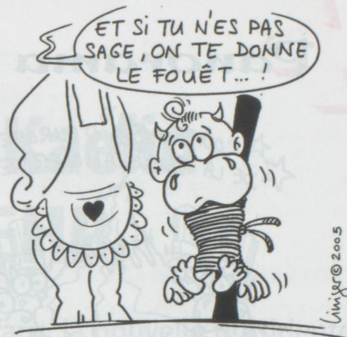
CHÂTIMENTS CORPORELS POUR LES MOINS DE 4 ANS...

■ Le rapport annuel sur les droits de l'homme du Département d'État américain relève plusieurs points négatifs en Suisse malgré une bonne appréciation générale. Si Washington juge la situation en Suisse globalement bonne, il recense des cas de mauvais traitements des polices cantonales de Genève, Glaris, Zurich et Berne, s'appuyant notamment sur des études d'Amnesty international. Le