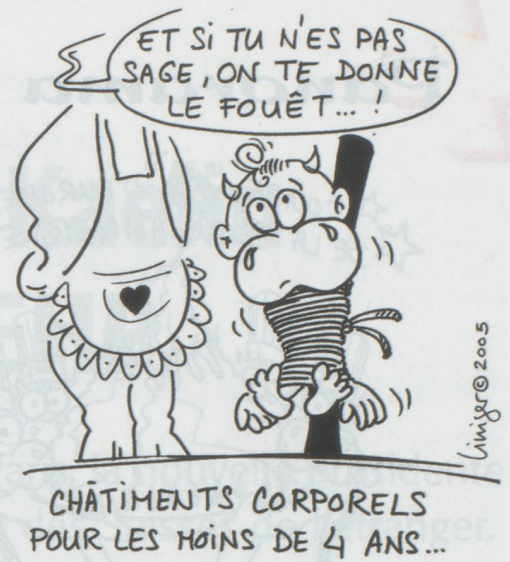
CHÂTIMENTS CORPORELS POUR LES MOINS DE 4 ANS...

■ Le rapport annuel sur les droits de l'homme du Département d'État américain relève plusieurs points négatifs en Suisse malgré une bonne appréciation générale. Si Washington juge la situation en Suisse globalement bonne, il recense des cas de mauvais traitements des polices cantonales de Genève, Glaris, Zurich et Berne, s'appuyant notamment sur des études d'Amnesty international. Le