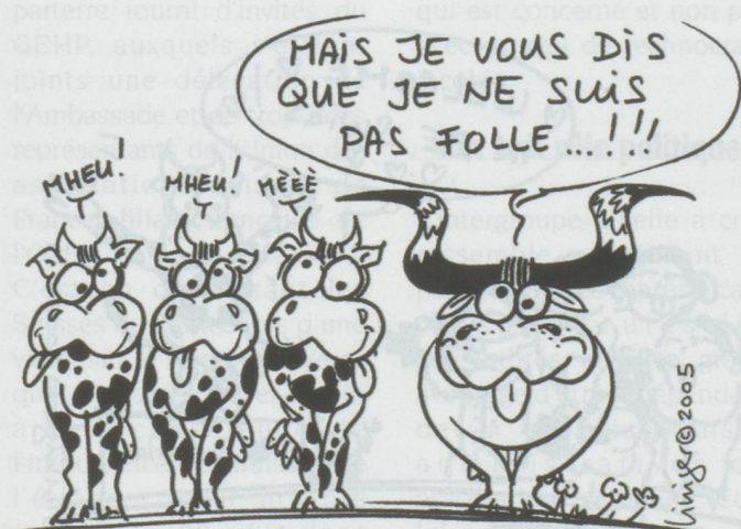
ESB EN SUISSE : 3 VACHES ET UN ZÉBU !...