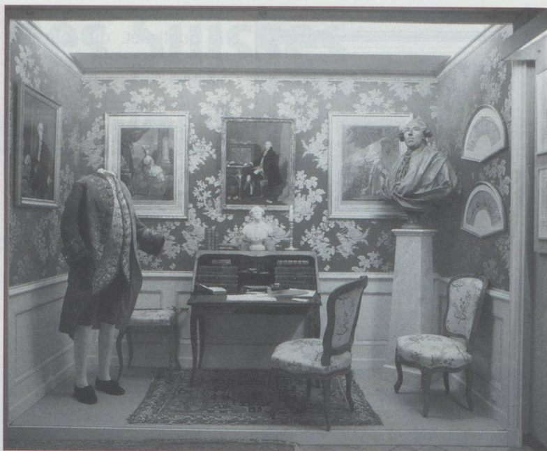
Alcôve Jacques Necker, consacrée au banquier de Louis XVI

Vers la fin des années soixante-dix, la collection, qui manquait de place à Coppet, fut transférée au Château de Penthes sur la commune de Pregny-Chambésy, petit manoir situé dans un magnifique parc aux portes du quartier international de Genève. Son propriétaire est l'Etat de Genève ; la Fondation en est l'usufruitière.