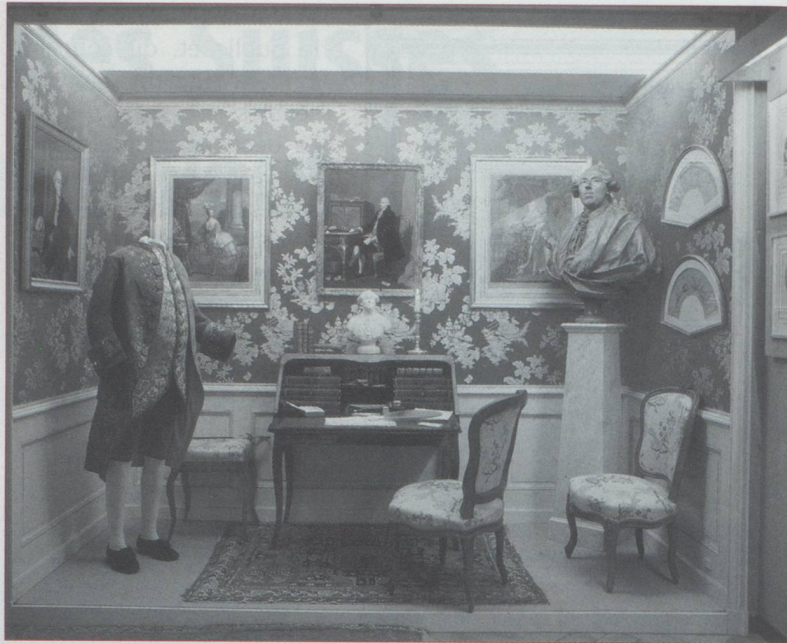
Alcôve Jacques Necker, consacrée au banquier de Louis XVI

d'hôtels de luxe et établi la réputation de la Suisse comme pays du tourisme haut de gamme. N'oublions pas non plus les diplomates et les consuls, dont Carl Lutz, qui a sauvé la vie de soixante mille juifs, à Budapest, pendant la Seconde Guerre mondiale, en leur procurant des papiers pour fuir en Israël. Et faisons honneur à l'architecte Le Corbusier, au constructeur de voitures Louis Chevrolet, à l'astronome Claude Nicollier ou à l'acteur de cinéma Michel Simon, etc.