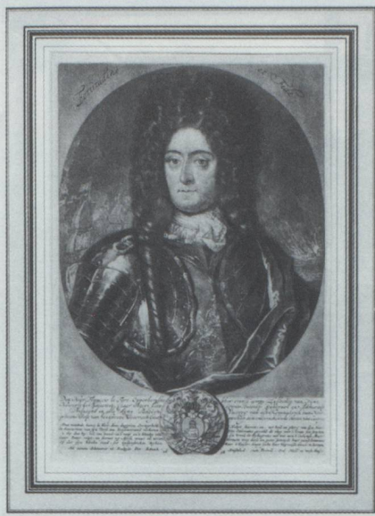
François Le Fort, au service de la France, des Provinces-Unies et de la Russie

le projet d'installer, dans l'ancien corps de garde des Suisses au Château de Versailles, un modeste musée franco-suisse. Des familles de descendants de ces "Suisses du Roi" ont mis de nombreux portraits, uniformes, armes, drapeaux, tambours, décorations, sceaux, traités, brevets, lettres de congé, décorations, lettres, gravures, etc. à leur disposition ; d'autres objets ont pu être acquis sur le marché des antiquaires au cours des années. Il faut dire que l'histoire militaire s'exprime à travers des objets hauts en