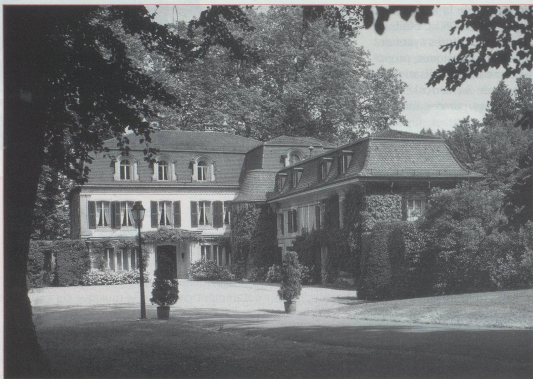
Entrée du château

Originaire de Berne, né en 1937, docteur en droit de l'Université de Bâle, est Président de la Fondation pour l'Histoire des Suisses dans le Monde et habite Genève. Ancien Délégué du Conseil fédéral aux accords commerciaux, ancien Chef de la Mission suisse auprès des Communautés européennes à Bruxelles, il a été, de 1997 à 2002, Ambassadeur de Suisse en France, expérience qui est à la base de son livre " Profession ambassadeur " (Editions Cabédita, Yens-sur-Morges, 2002).