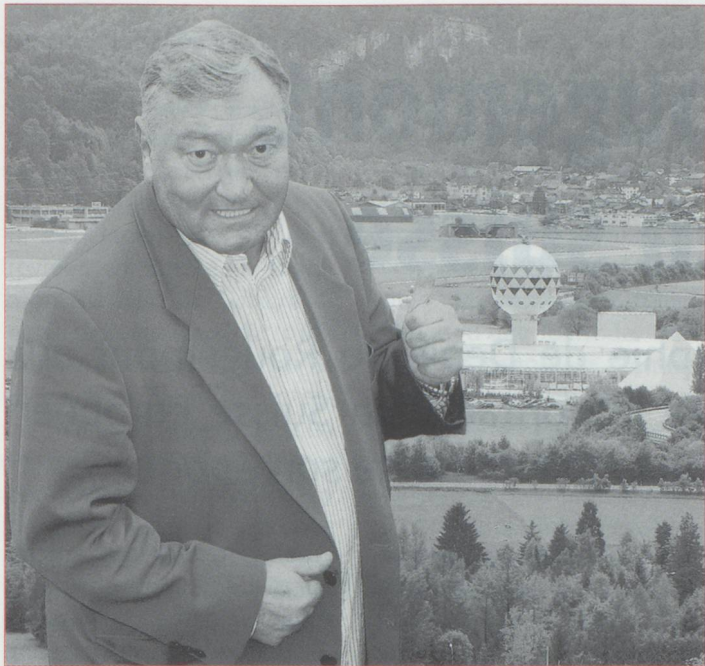
Erich von Däniken

large et 3,8 km de long semblables à des pistes ?”