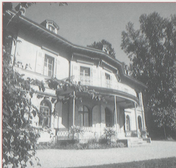
La façade sud de la Fondation

L'exposition a privilégié les recherches de Giacometti dès le milieu des années trente, époque où il réalisa