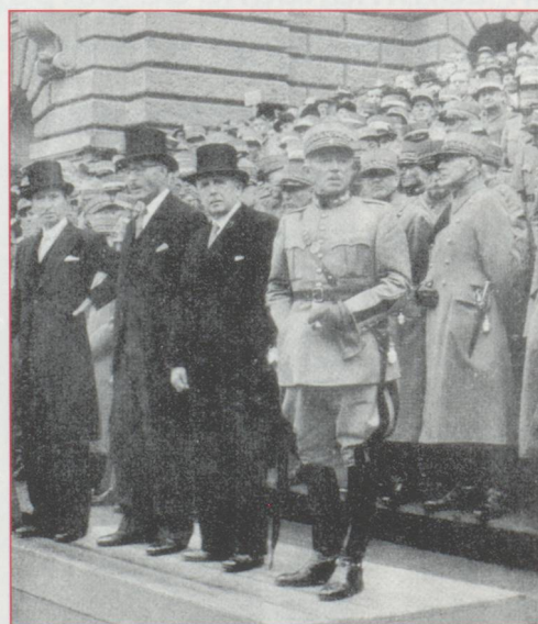
Le 19 août 1945, devant le Palais Fédéral, à Berne, le Général avant de "rentrer dans le rang" ; prenait congé de ses troupes.

d'un fort effet dissuasif, ce dont témoigne l'évolution des plans d'invasion de l'Axe entre Juin 1940 et 1941 ; le Réduit rendait la guerre éclair invraisemblable. La période du Réduit a permis également le développement des fortifications, l'équipement en armes nouvelles et l'entraînement de la troupe, contribuant à renforcer l'esprit de corps