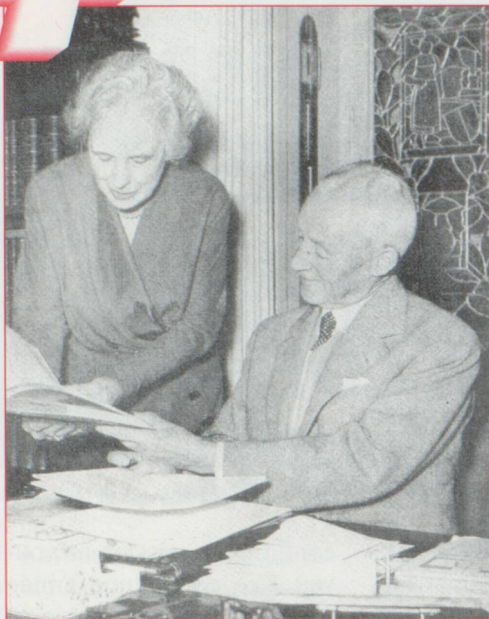
Le Général et Mme Henri Guisan dans le bureau personnel du Général.

tions données au commandant en chef le 31 Août par le Conseil fédéral, il a la responsabilité de "sauvegarder l'indépendance du pays et maintenir l'intégrité du territoire en mettant en œuvre tous les moyens appropriés". Il va remplir son rôle, non seulement du point de vue militaire, mais en devenant en outre le symbole du rassemblement et de la résistance.