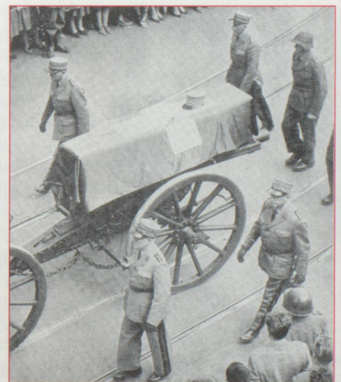
Les colonels, commandants de corps, garde d'honneur, marchent, une ultime fois, au côté de leur ancien chef.