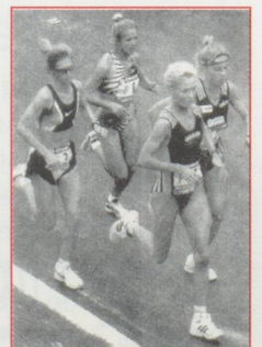
Franziska Rochat-Moser en tête dans le marathon de New York

Victime d'un accident de montagne le 7 mars, Franziska Rochat-Moser est décédée malgré les efforts des sauveteurs et médecins. Elle n'avait que 36 ans. Son grand exploit : être la première Suissesse à gagner le marathon de New-York, en 1997. Deux ans plus tard, elle finit deuxième du marathon de Boston mais bat le record suisse de la spécialité, record encore invaincu. L'automne dernier, elle avait décidé de mettre fin à sa carrière, pour se consacrer au restaurant de son époux Philippe Rochat, à Crissier.