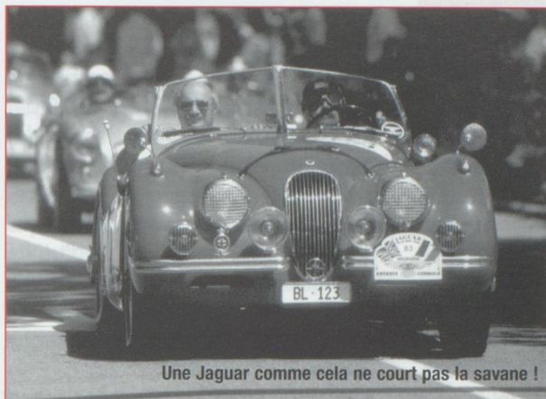
Une Jaguar comme cela ne court pas la savane !

La capitale fédérale accueille le week-end des 23 et 24 juin le Grand Prix Bern Revival 2001. L'occasion pour tous les spectateurs d'admirer de superbes voitures de courses et motos historiques. Organisé en 1998, le premier Revival avait attiré près de 50 000 curieux et passionnés. Cette année, un plateau spécial composé de Jaguar constituera la