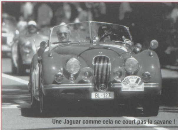
Une Jaguar comme cela ne court pas la savane !

La capitale fédérale accueille le week-end des 23 et 24 juin le Grand Prix Bern Revival 2001. L'occasion pour tous les spectateurs d'admirer de superbes voitures de courses et motos historiques. Organisé en 1998, le premier Revival avait attiré près de 50 000 curieux et passionnés. Cette année, un plateau spécial composé de Jaguar constituera la