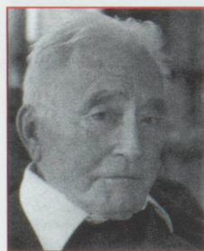
Georges-André Chevallaz, ancien président de la Confédération :

« Je l'aime bien, notre drapeau suisse, et je ne voudrais pas qu'on le change. De plus, le rouge est l'une des mes couleurs préférées. Le drapeau est par ailleurs un des éléments principaux du logo d'Expo.02. Sa forme et ses couleurs me font évidemment penser au drapeau de la Croix-Rouge et à sa vocation humanitaire. J'apprécie également le côté abstrait de son graphisme qui permet plusieurs interprétations. »