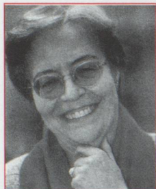
Yvette Jaggi, présidente de Pro Helvetia:

► d'émotion. Il me plaît dans la mesure où il me fait penser - même si les relations de cause à effet ne sont pas évidentes - à mes racines chrétiennes et à la Croix-Rouge, en même temps qu'à l'histoire de ce pays à laquelle je suis attaché, d'autant plus que je l'enseigne. »