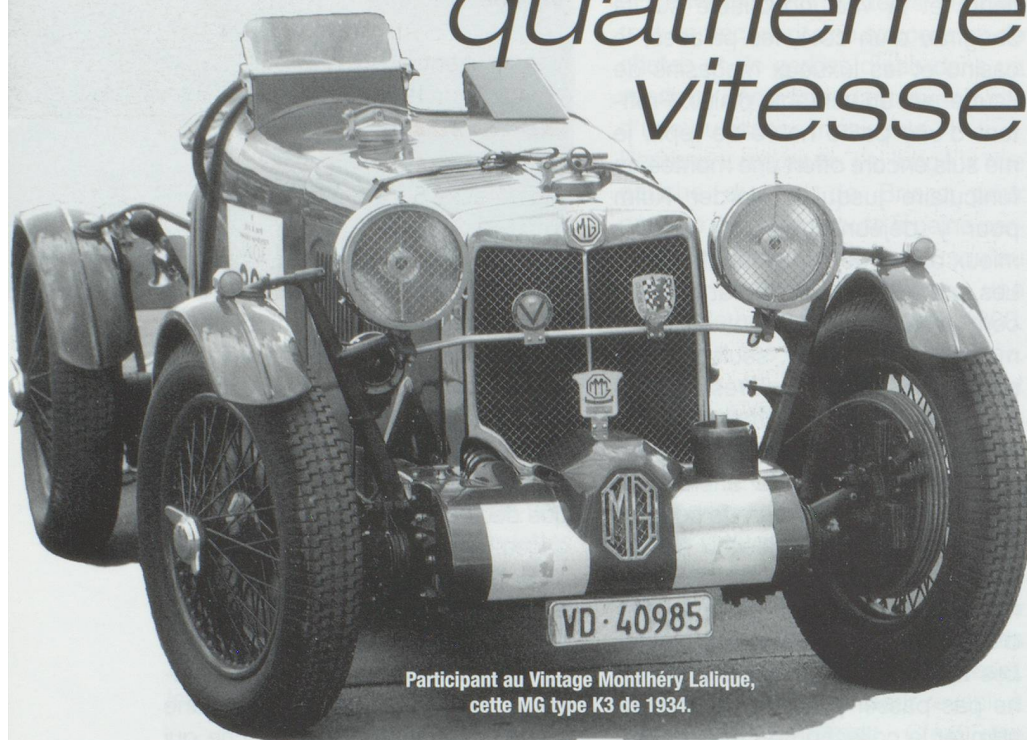
Participant au Vintage Montlhéry Lalique, cette MG type K3 de 1934.

Pic Pic, Hispano - Suiza, Martini, Moser, Zedel, Egg, Tribelhorn, Turicum, Dumon... Que de noms mythiques, pour les passionnés de l'automobile, mais aussi que d'histoires passionnantes. À l'approche des vacances nous vous proposons un tour de la Suisse en 12 musées.