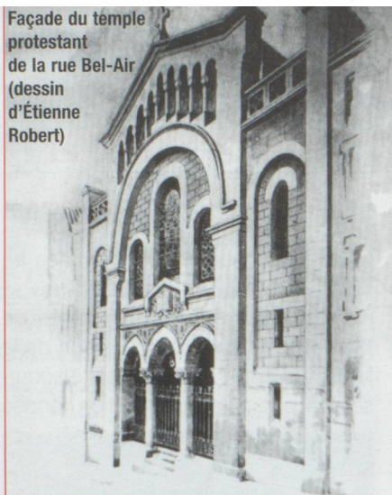
Façade du temple protestant de la rue Bel-Air (dessin d'Étienne Robert)

► réputation de qualification, de probité et d'application au travail des Suisses de Marseille, leur pratique du français, la position de leurs notables et l'ancienneté de leur installation surent toujours les protéger.