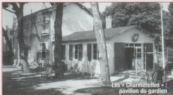
Les « Charmerettes » : pavillon du jardin

vie au Consulat général de Marseille, et espérons que ses onze collaborateurs sauront trouver les moyens et façons de motiver les compatriotes toujours prêts à s'investir dans la promotion et la défense de leur pays. +