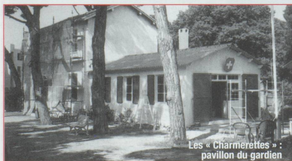
Les « Charmettes » : pavillon du gardien

vie au Consulat général de Marseille, et espérons que ses onze collaborateurs sauront trouver les moyens et façons de motiver les compatriotes toujours prêts à s'investir dans la promotion et la défense de leur pays. +