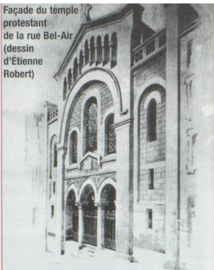
Façade du temple protestant de la rue Bel-Air (dessin d'Étienne Robert)