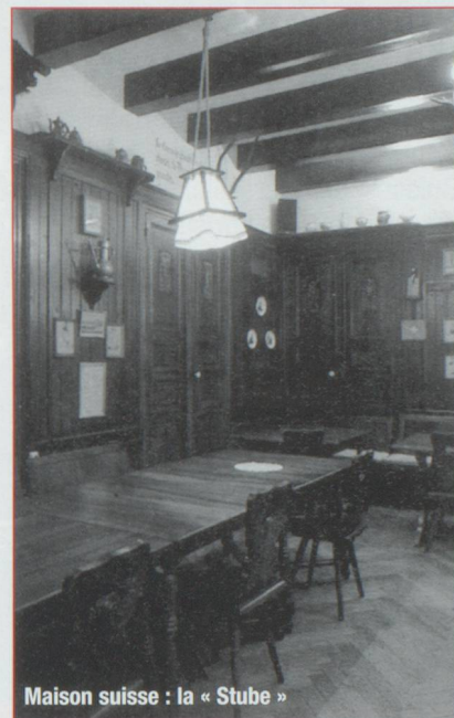
Maison suisse : la « Stube »

Cette forte personnalité, nommée en 1917, et venue de Suisse contrairement à ses prédécesseurs issus de Marseille, participa à la création de la Maison suisse, 7 rue d'Arcole, acquise grâce à une souscription lancée