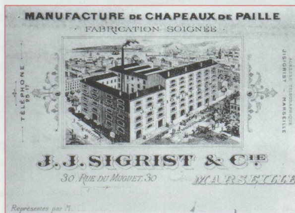
Des chapeaux glaronnais sous le grand soleil de Marseille