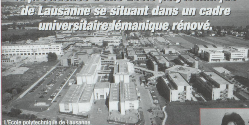
L'École polytechnique de Lausanne