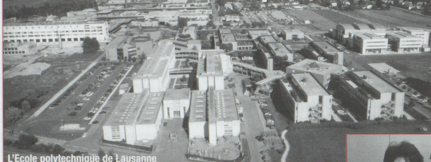
L'Ecole polytechnique de Lausanne