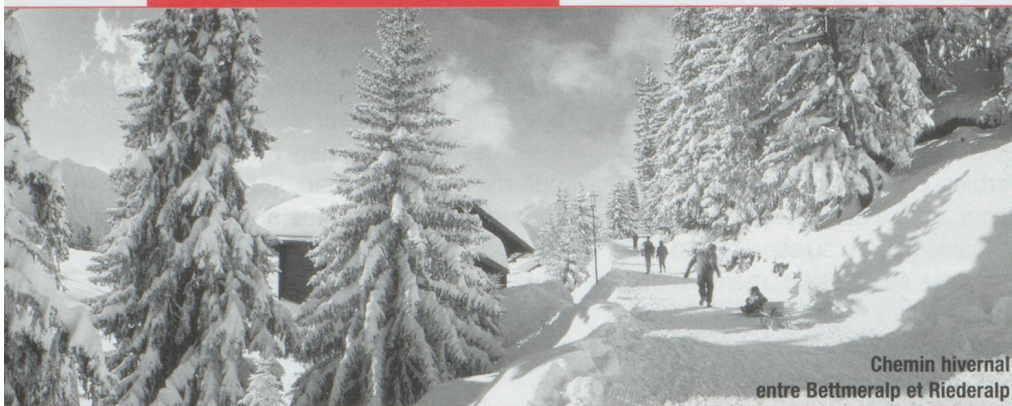
Chemin hivernal entre Bettmeralp et Riederalp

► te sera comblé. Celui qui recherche une neige profonde garantie jusqu'au printemps montera à 2 000 m jusqu'à Arolla. Il skiera avec un immense plaisir et sans trop de difficultés, escorté par quelques choucas évoluant dans un ciel d'azur. Le soir venu, au « carnotzet » de l'hôtel, une raclette accompagnée de viande séchée et de fines tranches de pain de seigle ne se refuse pas. Si l'envie d'aventure vous prend, vous pourrez monter au Pigne d'Arolla en hélicoptère et faire une descente fabuleuse sous la conduite indispensable d'un guide de haute montagne. Le val d'Anniviers, avec ses adorables villages, mérite tout autant notre affection. Saint-Luc, reconstruit en pierre après un dernier incendie en 1859, Grimentz, peut-être le plus typique du canton, Chandolin et Vercorin sont des endroits idylliques pour celui qui souhaite éviter la foule. À Grimentz, le visiteur a droit à une