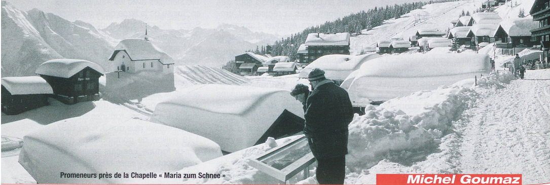
Promeneurs près de la Chapelle « Maria zum Schnee »