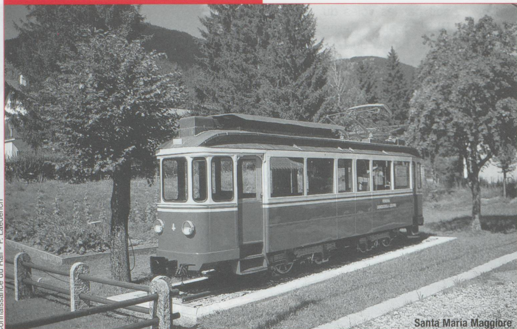
Santa Maria Maggiore

entrons en gare d'Intragna, où là encore nous croisons une rame moderne, tandis qu'un autobus assure la correspondance vers les villages voisins. Dès la sortie de la gare, un impressionnant viaduc nous fait franchir la Maggia, torrent qui déverse ses eaux et ses alluvions dans le lac Majeur entre Ascona et Locarno. Le parcours se poursuit ensuite en pente plus douce dans une vallée qui s'élargit vers la droite. La gare de Ponte Brolla est précédée sur la gauche par un embranchement à deux voies se terminant