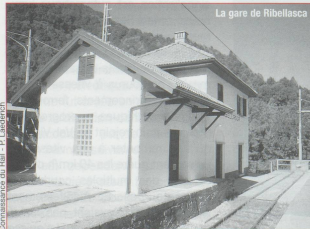
La gare de Ribellasca

Particulièrement varié et intéressant aussi bien sur le plan touristique que ferroviaire, le parcours sur la ligne des Centovalli mérite absolument le voyage. Si un premier aller-retour en trains directs permet de se faire une première idée, il mérite d'être complété par des voyages en omnibus en multipliant les étapes intermédiaires afin de découvrir plus en détail les merveilles que recèlent les Centovalli sur le versant suisse et le Val Vigezzo côté italien. +