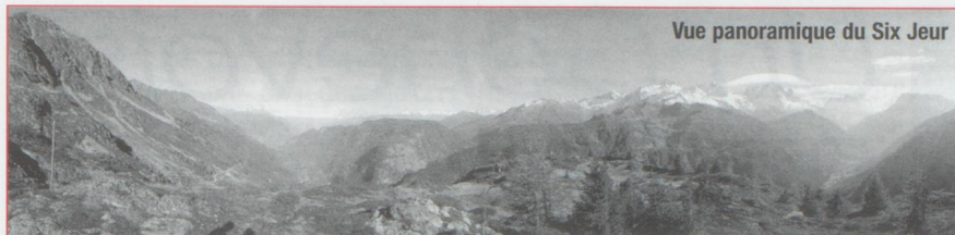
Vue panoramique du Six Jeur