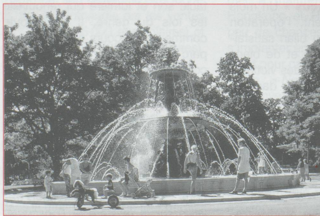
Les grands spectacles des Fêtes de Genève se dérouleront sur la rive gauche et au Jardin anglais

à y flâner. Du vendredi 30 juillet au dimanche 8 août, les Fêtes de Genève retrouveront pendant dix jours le centre de la ville autour de la rade. Avec ses traditionnelles animations - sur la rive droite, la fête foraine, les stands et les buvettes, les grands spectacles étant réservés à la rive gauche et au Jardin anglais. Sur la place de l'Île, un espace proposera un programme de musique classique sur le thème « Le fil de l'eau ». De multiples attractions sont prévues, pour tous les publics : un week-end techno avec une vingtaine de camions « Lovemobiles », de la musique classique dans le bâtiment des