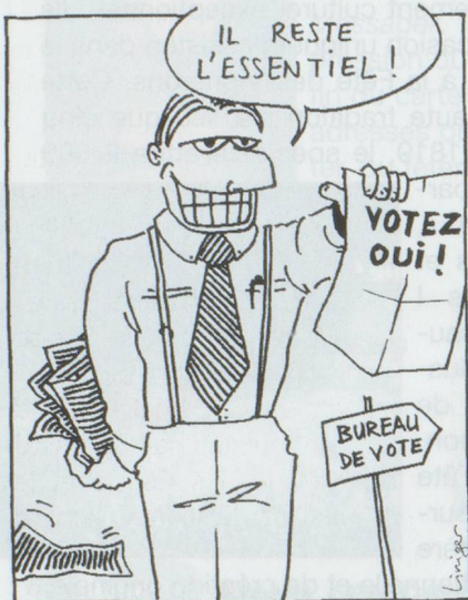
TEXTE ROMAND : UN PEU ÉCOURTÉ!

Nouvelle constitution : Le texte définitif de la mise à jour de la Constitution a été rendu public. Il a été publié officiellement dans la Feuille fédérale et paraîtra prochainement sous forme de brochure. Celle-ci peut être obtenue gratuitement auprès de l'Office central