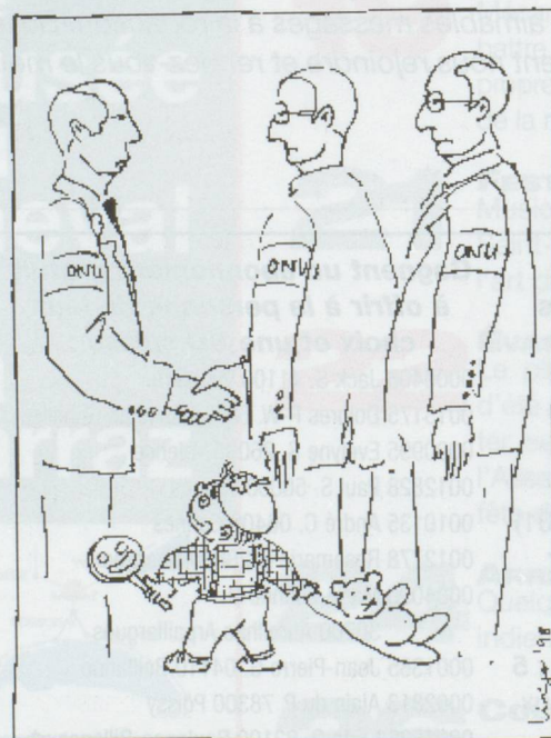
M'SIEUR L'ONU, J'PEUX JOUER AVEC VOUS?