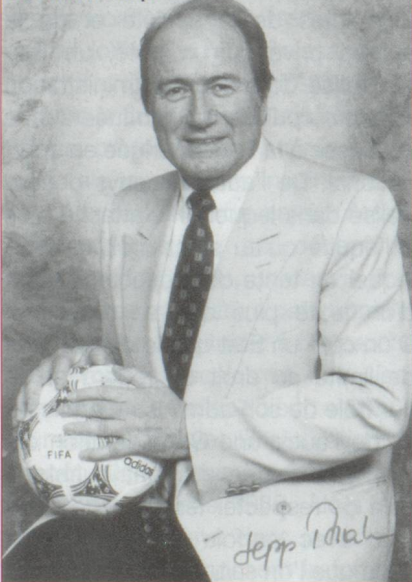
Joseph Blatter à la tête de la FIFA : une victoire surprise.