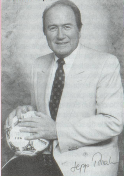
Joseph Blatter à la tête de la FIFA : une victoire surprise.