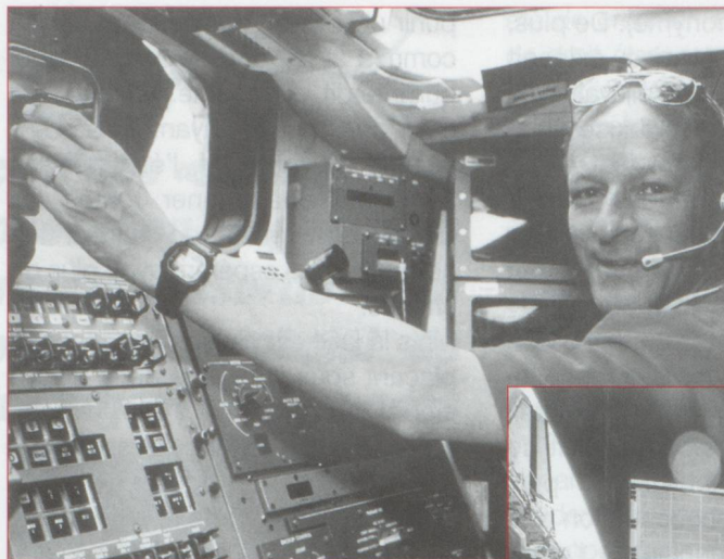
Claude Nicollier la tête dans les étoiles : au cours de la prochaine mission Hubble, l'astronaute vaudois passera le cap des 1 000 heures dans l'espace.

À quand un tiers de femmes sur les listes électorales ? Peut être dès 1999. C'est l'objectif que vise un arrêté de la Commission des institutions politiques du Conseil national