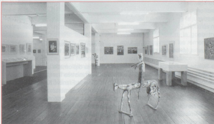
La Fondation pour l'art naïf suisse de St-Gall fête ses dix ans. Dix ans après sa création, sa collection compte 1300 œuvres de 80 artistes et 46 expos à son actif. L'institution, qui dispose depuis 1995 de son propre musée à St-Gall, a édité 17 publications. Renseignements : 00 41 71 223 58 57

Le comédien Jean-Luc Bideau envisage de quitter la Comédie Française. Il estime qu'avec l'actuel administrateur, il n'a pas la possibilité d'avoir des rôles intéressants. En attendant, il se prépare à jouer "Les Huissiers" de Michel Vinaver au Théâtre de la Colline.