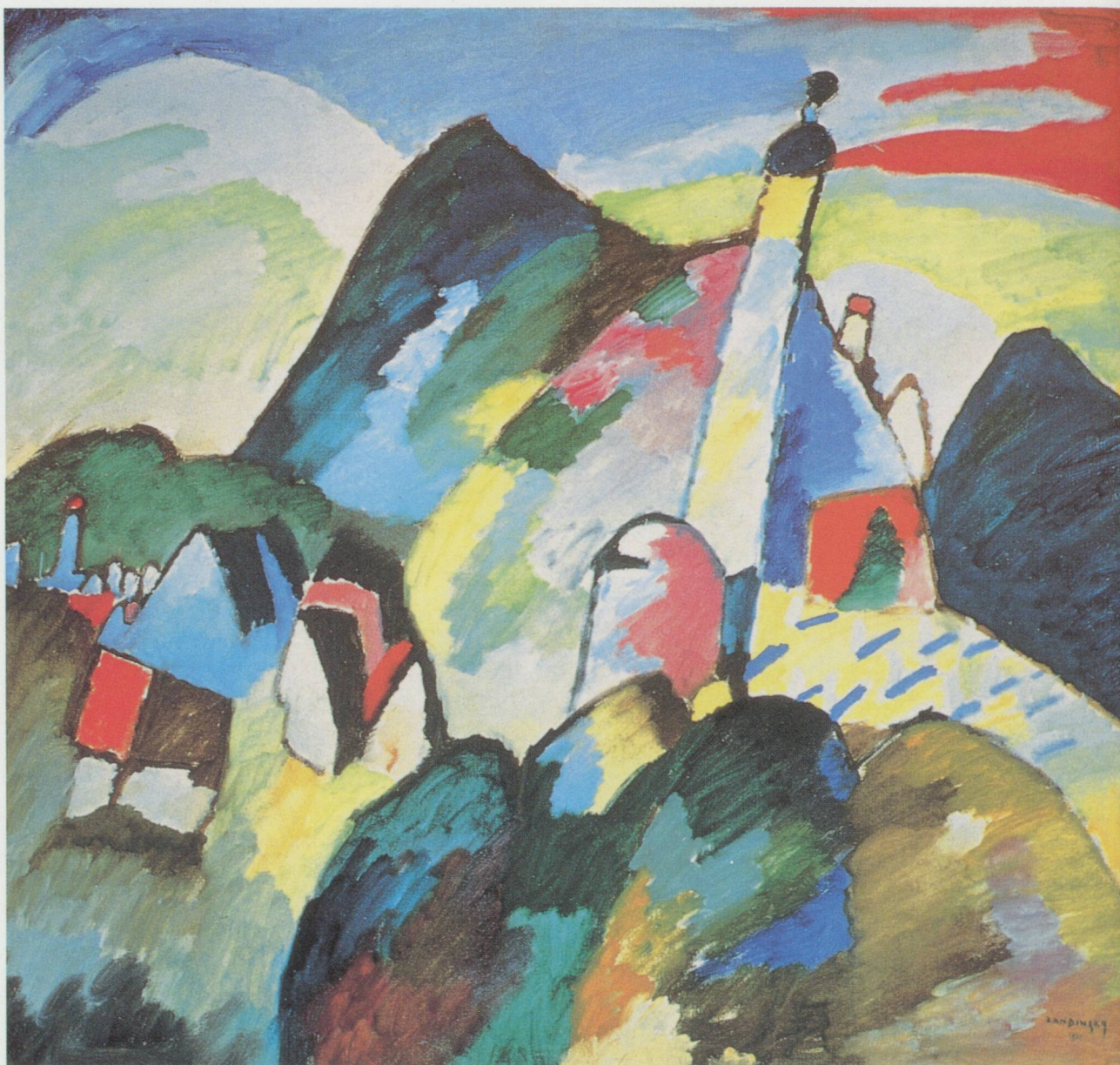
Wassily Kandinsky, Murnau avec église , 1910, Stedelijk Van Abbemuseum, Eindhoven