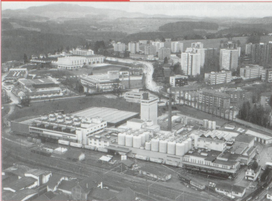
La brasserie Cardinal restera à Fribourg.