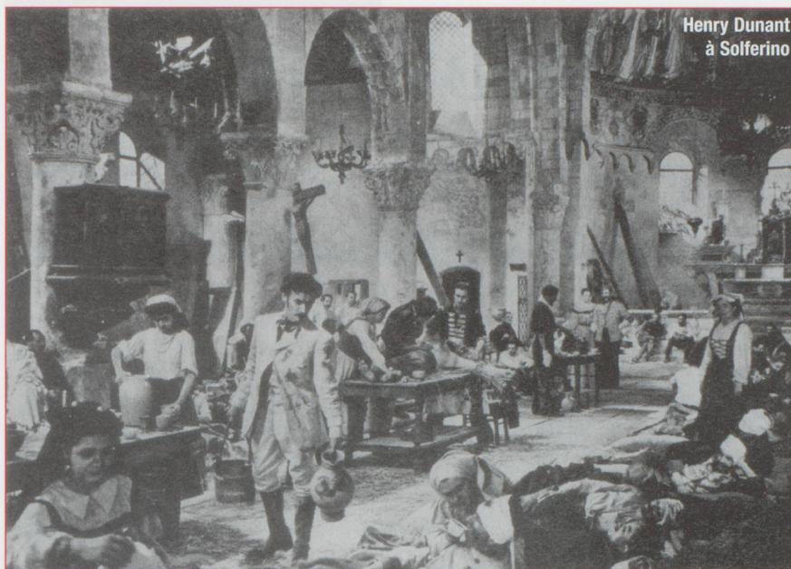
Henry Dunant à Solferino

l'absence de concessions pour les sources. Sur le champ de bataille de Solferino, il se lança à corps perdu dans la distribution des rares gouttes d'eau épargnées par la bataille.