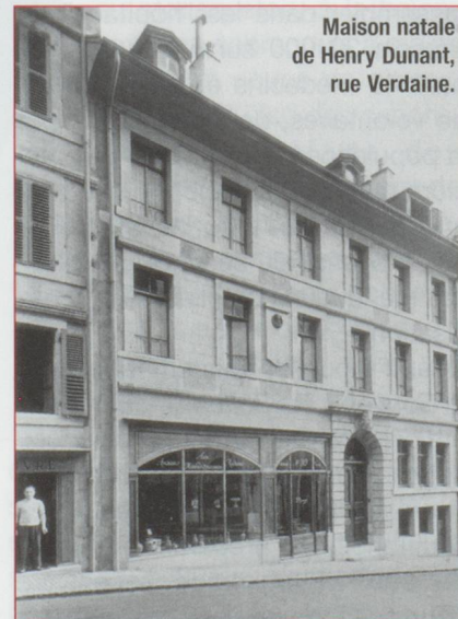
Maison natale de Henry Dunant, rue Verdaine.