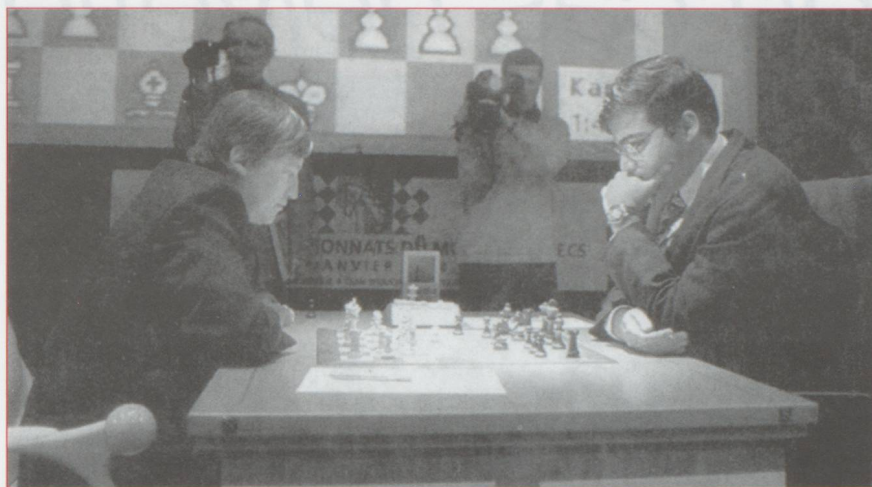
Karpov conserve son titre à Lausanne : pour la première fois dans l'histoire des Championnats du monde d'échecs, le titre s'est joué au termes de parties rapides. Les deux premières auront suffi au russe (à gauche) pour défaire son challenger, l'indien Viswanathan Anand.

de l'emmental va demander l'Appellation d'Origine Contrôlée.