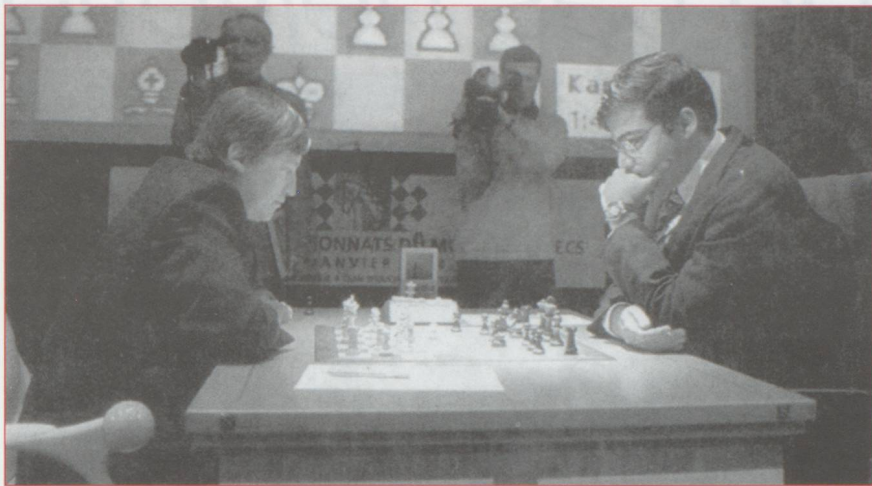
Karpov conserve son titre à Lausanne : pour la première fois dans l'histoire des Championnats du monde d'échecs, le titre s'est joué au termes de parties rapides. Les deux premières auront suffi au russe (à gauche) pour défaire son challenger, l'indien Viswanathan Anand.

de l'emmental va demander l'Appellation d'Origine Contrôlée.