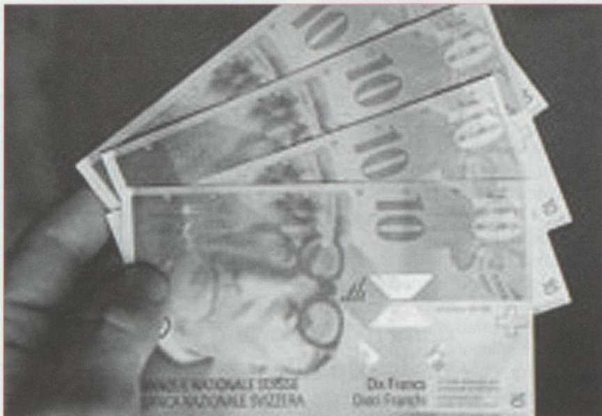
Le nouveau billet de 10 francs est en circulation. Il comporte un portrait de Charles-Edouard Jeanneret dit Le Corbusier.

Au nom de la reprise, la Banque Nationale Suisse tolère une légère inflation. Elle vise un taux annuel de 1 à 2 %.