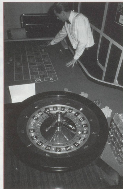
À quand deux catégories de casinos en Suisse? Une réforme en projet prévoit qu'excepté sept maisons de jeux triées sur le volet, les casinos fonctionneront avec des mises limitées.

Près de 730 militaires épauleront la police lors du centenaire du 1 er Congrès sioniste de 1897 qui réunira 1 500 personnes le 31 août prochain à Bâle.