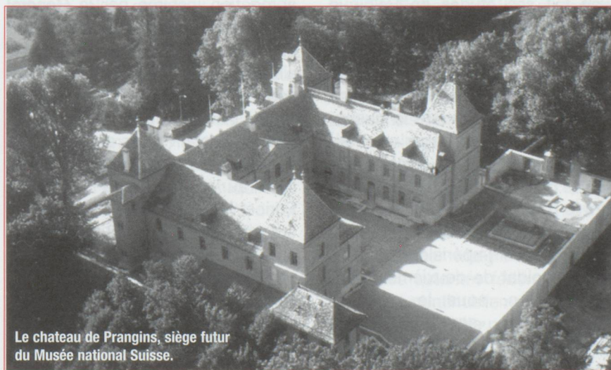
Le château de Prangins, siège futur du Musée national Suisse.

Bien que désapprouvé publiquement par Napoléon III, à la suite d'un discours intempestif en Corse, Plon-Plon resta fidèle à son cousin. Celui-là le chargea, en 1870, d'alerter le roi d'Italie pour qu'il intervienne