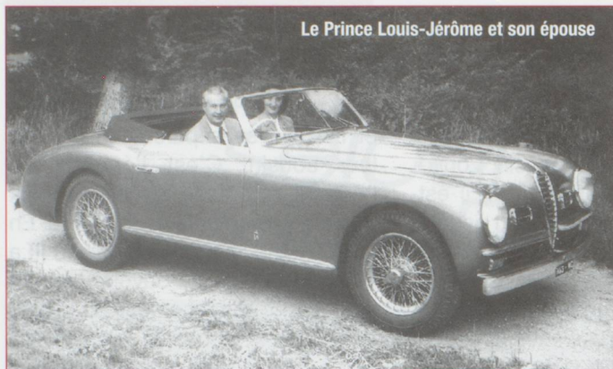
Le Prince Louis-Jérôme et son épouse

dans le conflit. Mais Sedan arriva trop tôt. Plon-Plon s'efforça encore d'aider Napoléon III à bâtir un plan de retour en France. L'Empereur était prêt à cette nouvelle aventure quand il mourut des suites d'une opération qu'il avait lui-même souhaitée.